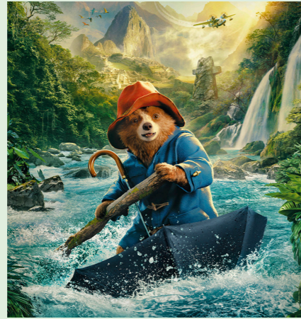
PADDINGTON I PERU 106 min. Mandag 17. november 2025 kl. 15.30 Tirsdag 18. november 2025 kl. 15.30