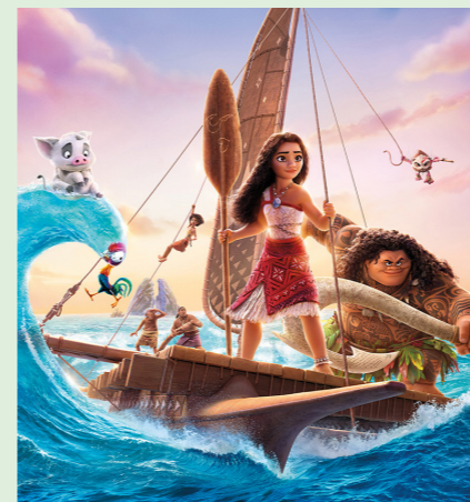
VAIANA 100 min. Mandag 23. februar 2026 kl. 15.30 Tirsdag 24. februar 2026 kl. 15.30