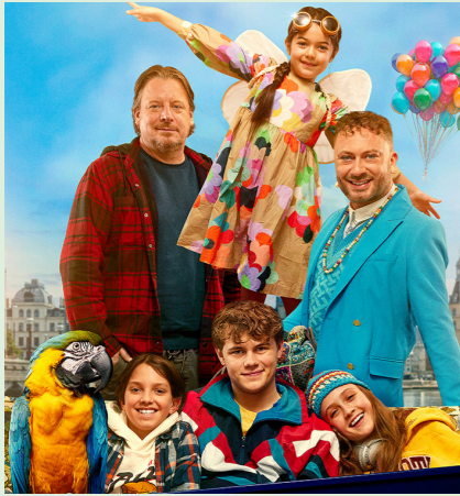
BØRNENE FRA SØLVGADE 102 min. Mandag 20. oktober 2025 kl. 15.30 Tirsdag 21. oktober kl. 15.30