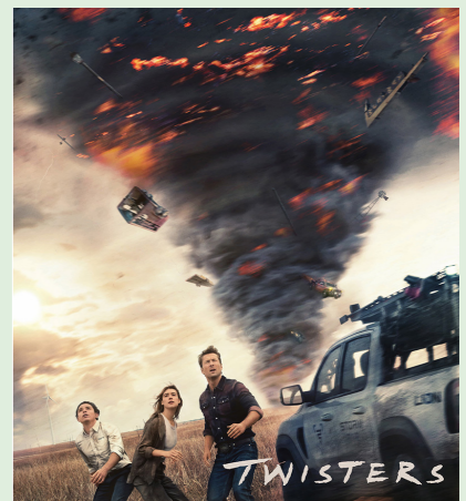
TWISTERS 122 min. Tirsdag 24. februar 2026 kl. 15.15