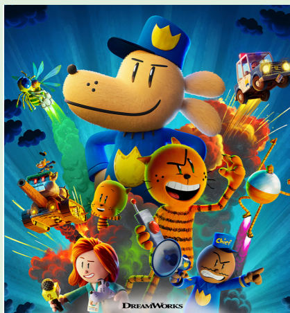
HUNDEMAND 87 min. Mandag 16. marts 2026 kl. 15.30 Tirsdag 17. marts 2026 kl. 15.30