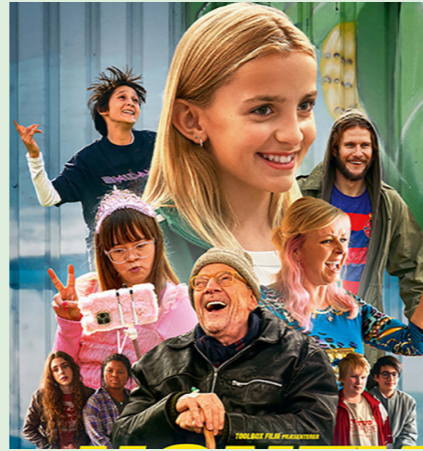
HONEY 94 min. Mandag 20. oktober 2025 kl. 15.30 Tirsdag 21. oktober kl. 15.30