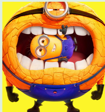
GRUSOMME MIG 95 min. Mandag 19. januar 2026 kl. 15.30 Tirsdag 20. januar 2026 kl. 15.30