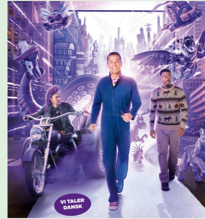
HARALD OG DEN MAGISKE BLYANT 91 min. Mandag 17. november 2025 kl. 15.30 Tirsdag 18. november 2025 kl. 15.30