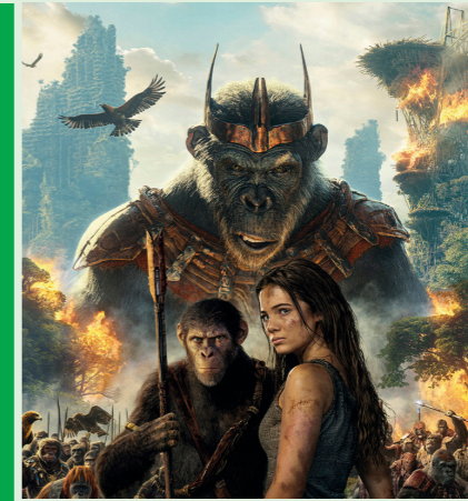
KINGDOM OF THE PLANET OF APES 145 min. Tirsdag 21. oktober 2025 kl. 15.15