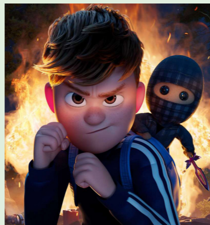
TERNET NINJA 3 85 min. Mandag 16. marts 2026 kl. 15.30 Tirsdag 17. marts 2026 kl. 15.30