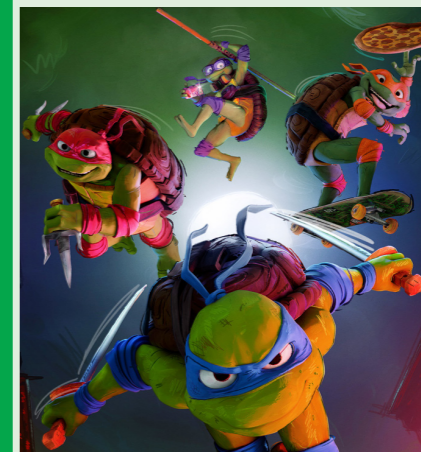
TEENAGE MUTANT NINJA TURTLES 99 min. Tirsdag 20. januar 2026 kl. 15.00