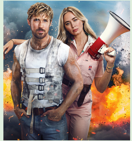
THE FALL GUY 126 min. Tirsdag 18. november 2025 kl. 15.15