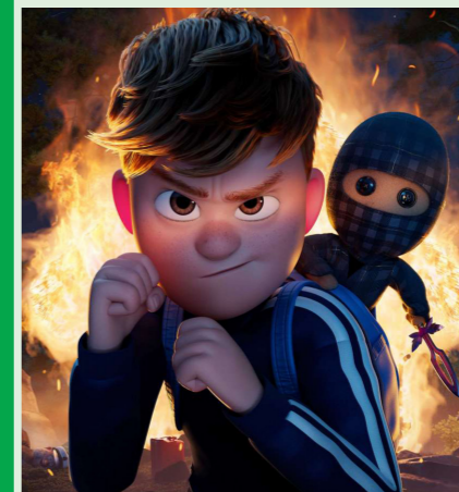
TERNET NINJA 3 85 min. Tirsdag 17. marts 2026 kl. 15.15